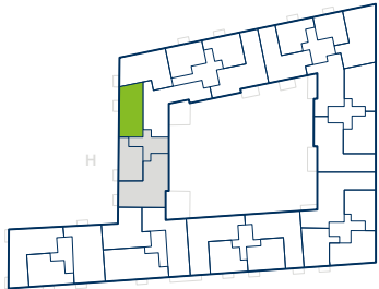
1. OG-5. OG